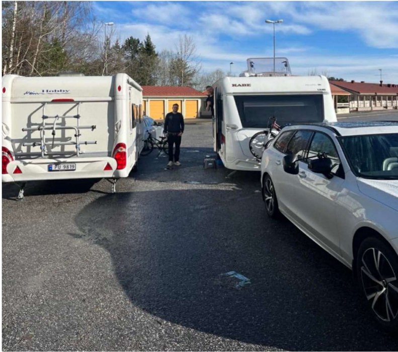
God stemning etter en natt på gamle Svinesund tollstasjon, svensk side.