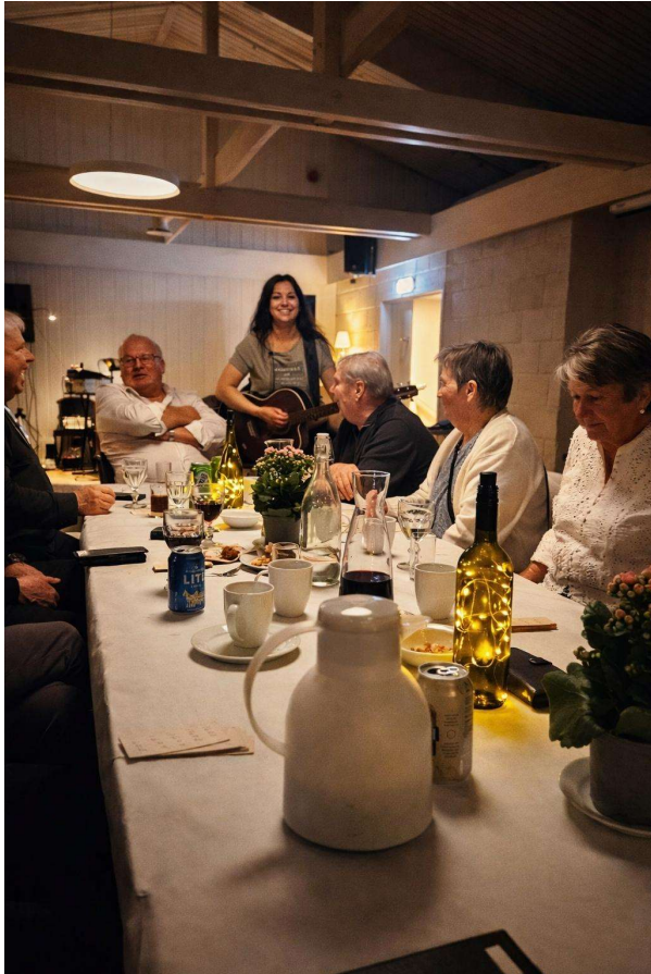
Cafe Kopp Catering.

Festkomiteen hadde (som vanlig) gjort en flott jobb. Vi fikk deilig koldtbord å spise, fra