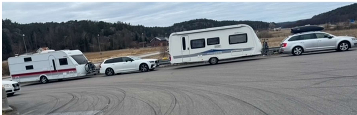
Ett liten stopp for mat og kaffe sør for Strømstad

Allerede på vei nedover merket vi hvor sosialt det er å reise flere sammen. Små stopp underveis blir ekstra hyggelige– med kaffe, litt mat og barn som gleder seg til det som venter.