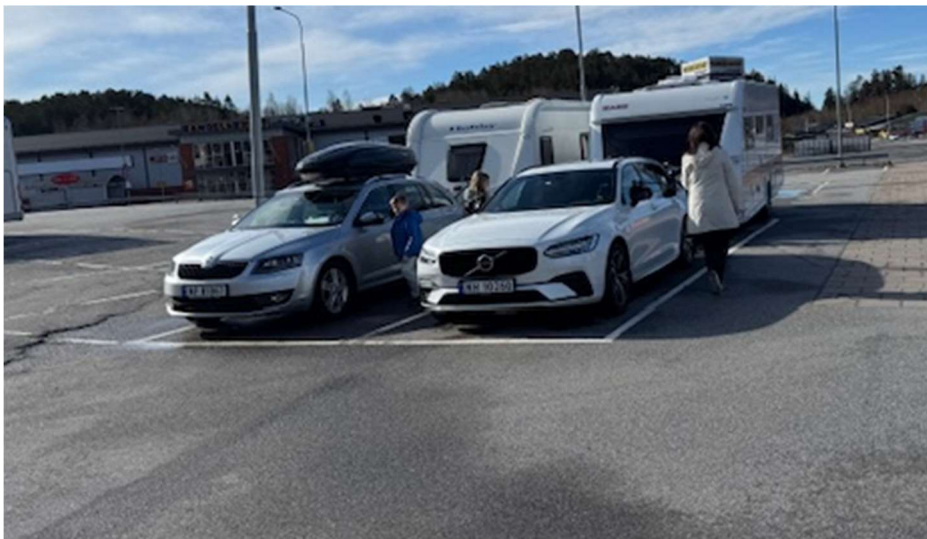
Grensehandel på Svinesund før turen går videre

Ved ankomst Bogstad camping fikk vi brukt en av NBCC medlemsfordeler. Medlemskap i NBCC gir 20 % rabatt hos Topcamp. Bogstad camping er nok kjent for mange av dere. En fin campingplass, som de senere år har blitt mye oppgradert. Også denne campingen har tømmeautomat for toalett-kassetter, tommel opp for det! Bogstad camping ligger også fint til med tanke på kollektivtransport ned til sentrum. Planen var én natt, men første påskedag våknet vi til snø og slaps. Bogstad ligger høyt, og vinteren hadde tydeligvis ikke sluppet taket.